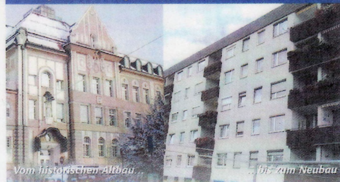
Vom historischen Altbau...